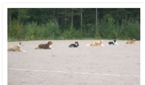
ALO paikalla makuu.