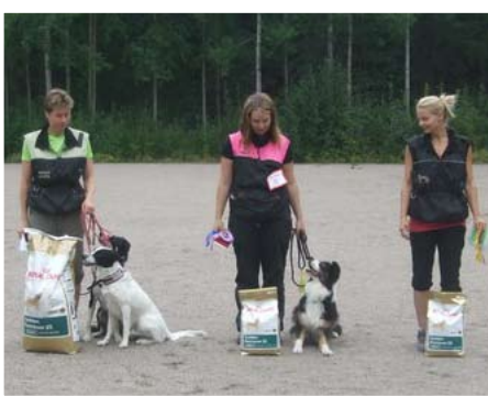
AVO palkintojen jako.