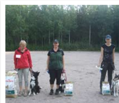
EVL palkintojen jako.