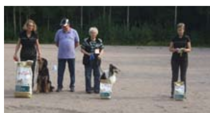
VOI palkintojen jako.